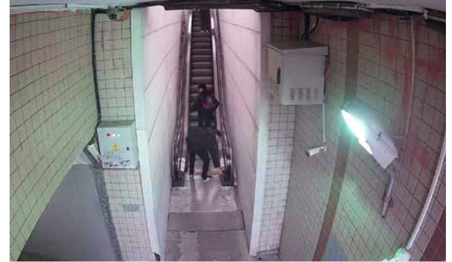
ABB Yasal Takip Başlattı!

Açılış töreni, Ankara Kulübü Derneği çocuk seğmenlerinin sergilediği halk oyunları gösterisiyle renklenirken, programa katılan vatandaşlar keyifli anlar yaşadı. HABER MERKEZİ