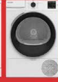
8100 MX Kurutma Makinesi