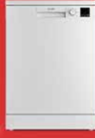
6433 Bulağık Makinesi