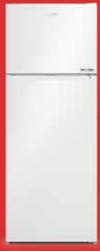
570477 MB No Frost Buzdolabı

Arçelik 3'lü Beyaz Eşya Çeyiz Seti 55.999 TL'DEN Başlayan Fiyatlarla!