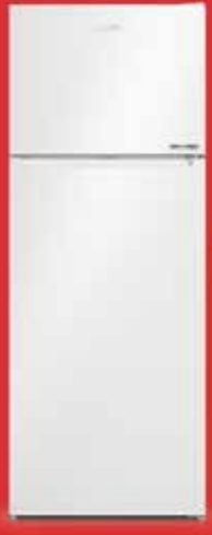
570477 MB No Frost Buzdolabı

Arçelik 3'lü Beyaz Eşya Çeyiz Seti 55.999 TL'DEN Başlayan Fiyatlarla!