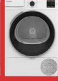
8100 MX Kurutma Makinesi