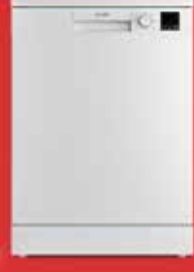
6433 Bulaşık Makinesi