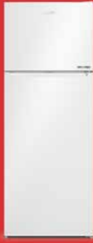
570477 MB No Frost Buzdolabı

Erkan Çelik 0543 867 78 35 0354 212 74 34 A.Nohutlu Mah. Sinema Sokak Onur Kaytan Plaza 1/1 YOZGAT