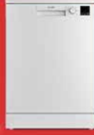
6433 Bulaşık Makinesi