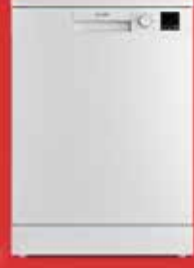
6433 Bulaşık Makinesi