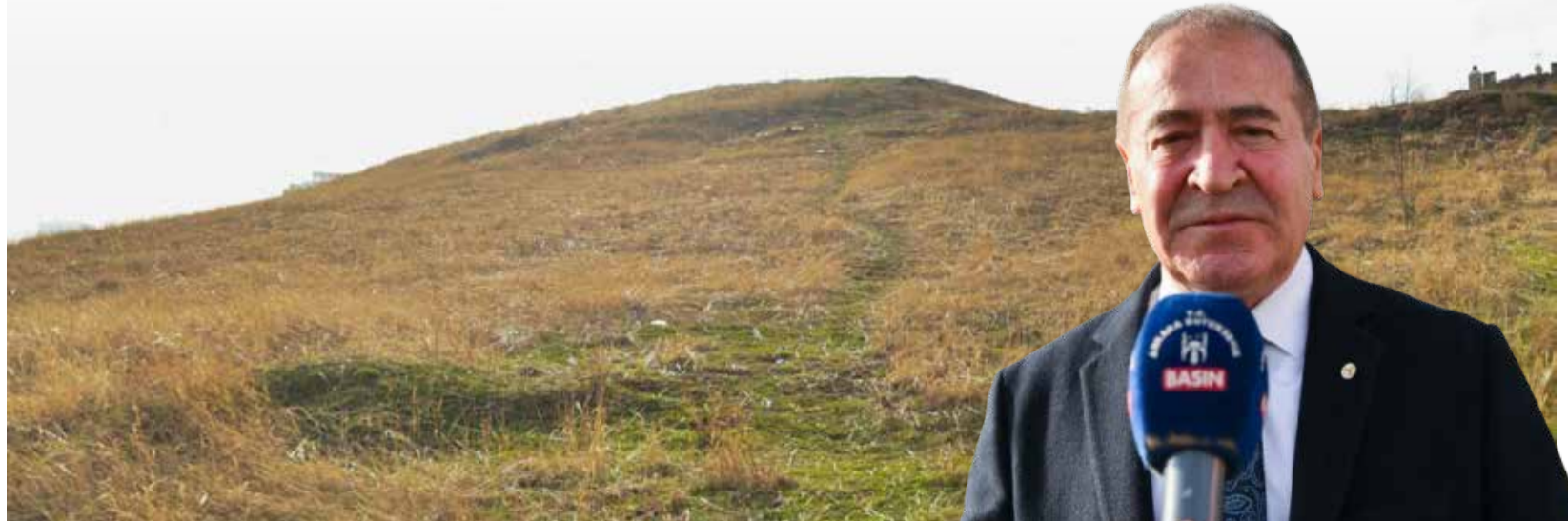
ABB Tümülüsleri Gün Yüzüne Çıkarıyor

Ankara Büyükşehir Belediyesi, Başkent'in tarihi ve kültürel mirasını yeniden canlandırmak için çalışmalarına hız kesmeden devam ediyor. Kültür ve Tabiat Varlıkları Daire Başkanlığı, Başkentte bulunan tümülüsleri görünür hâle getirmek için harekete geçti.