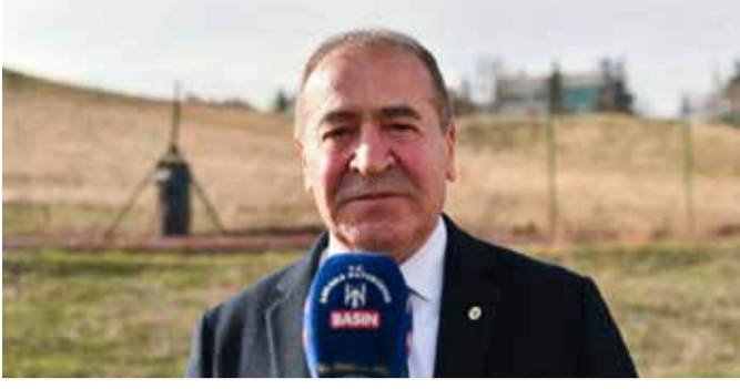
ABB Tümülsleri Gün Yüzüne Çıkarıyor

Ankara Büyükşehir Belediyesi, Başkent'in tarihi ve kültürel mirasını yeniden canlandırmak için çalışmalarına hız kesmeden devam ediyor.