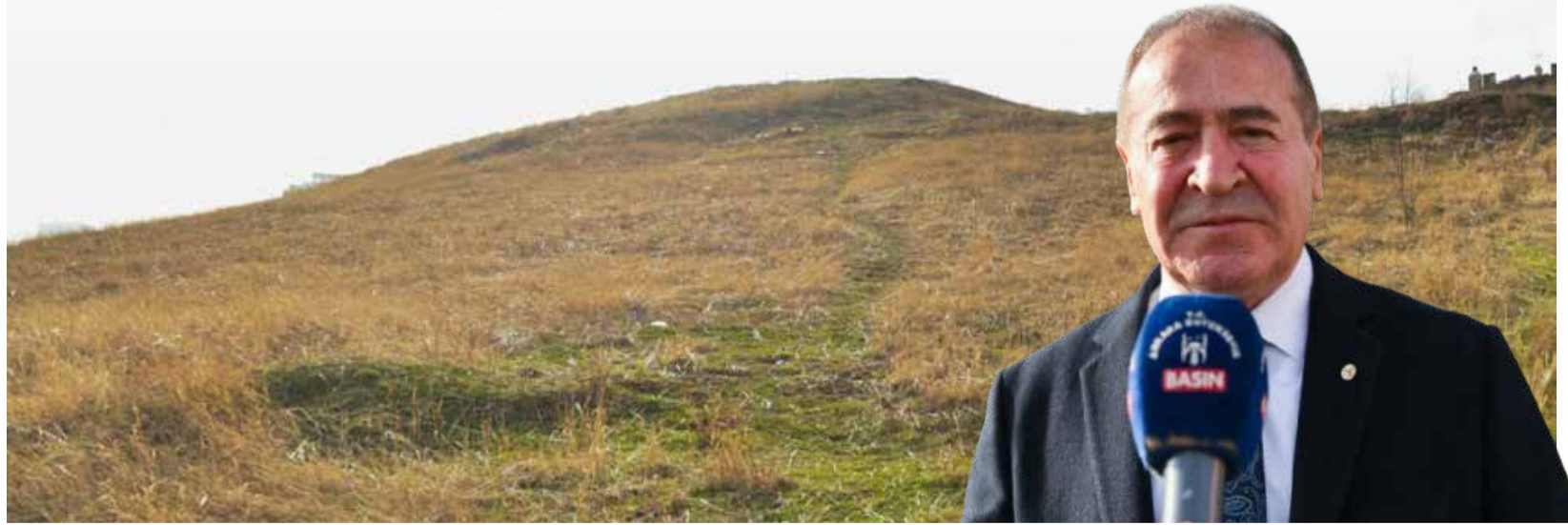
ABB Tümülüsleri Gün Yüzüne Çıkarıyor

Ankara Büyükşehir Belediyesi, Başkent'in tarihi ve kültürel mirasını yeniden canlandırmak için çalışmalarına hız kesmeden devam ediyor. Kültür ve Tabiat Varlıkları Daire Başkanlığı, Başkentte bulunan tümülüsleri görünür hâle getirmek için harekete geçti.