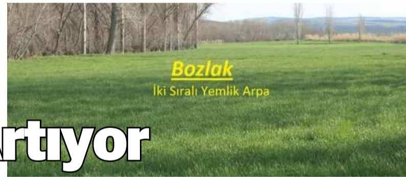
Bozlak İki Sıralı Yemlik Arpa