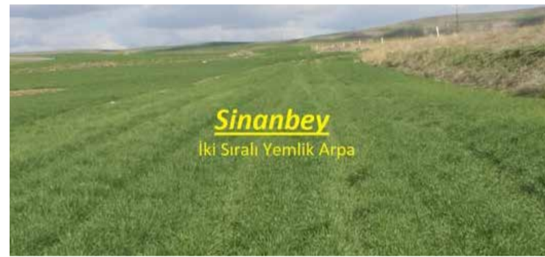
Sinanbey İki Sıralı Yemlik Arpa