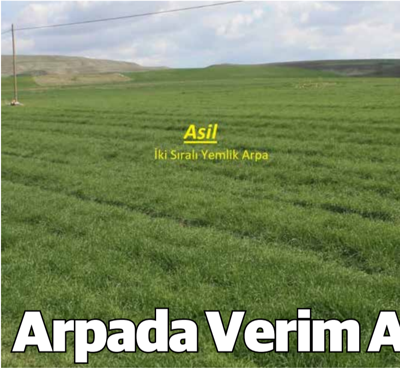
Asil İki Sıralı Yemlik Arpa