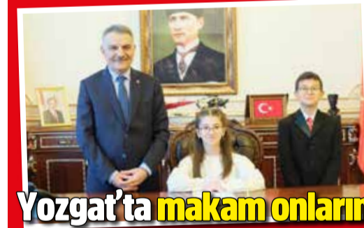
Yozgat'ta makam onların!

» Yozgat'ta 23 Nisan Ulusal Egemenlik ve Çocuk Bayramı kutlamaları, sabah saat 09.30'da Cumhuriyet Meydanı'nda bulunan Atatürk Anıtı'na çelenk sunulmasıyla başladı. Türkiye Büyük Millet Meclisi'nin açılışının 106. yıl dönümü, resmi törenlerle anıldı. 3'DE