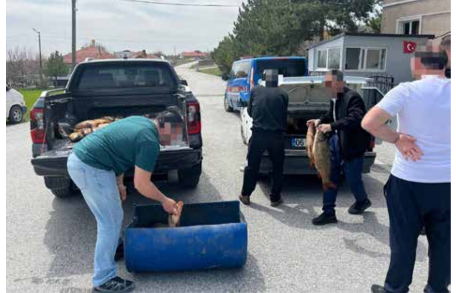
KAÇAK AVCILIK EKOSİSTEMİ TEHDİT EDİYOR

Açıklamada, özellikle iç sularda av yasağına aykırı faaliyet gösteren kişi ve gruplara yönelik kontrollerin sıklaştırıldığı belirtilerek, çevre suçlarına karşı sıfır tolerans anlayışıyla hareket edildiği ifade edildi.