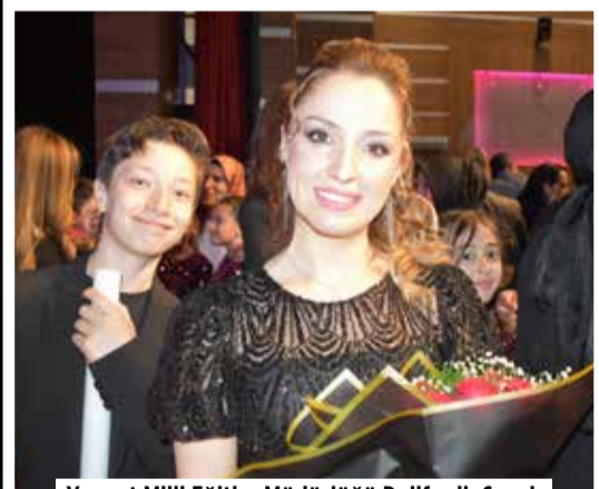
Yozgat Milli Eğitim Müdürlüğü Polifonik Çocuk Korosu tarafından düzenlenen "Uykudan Oyuna" Anneler Günü Özel Konseri, duygu dolu anlara sahne oldu.