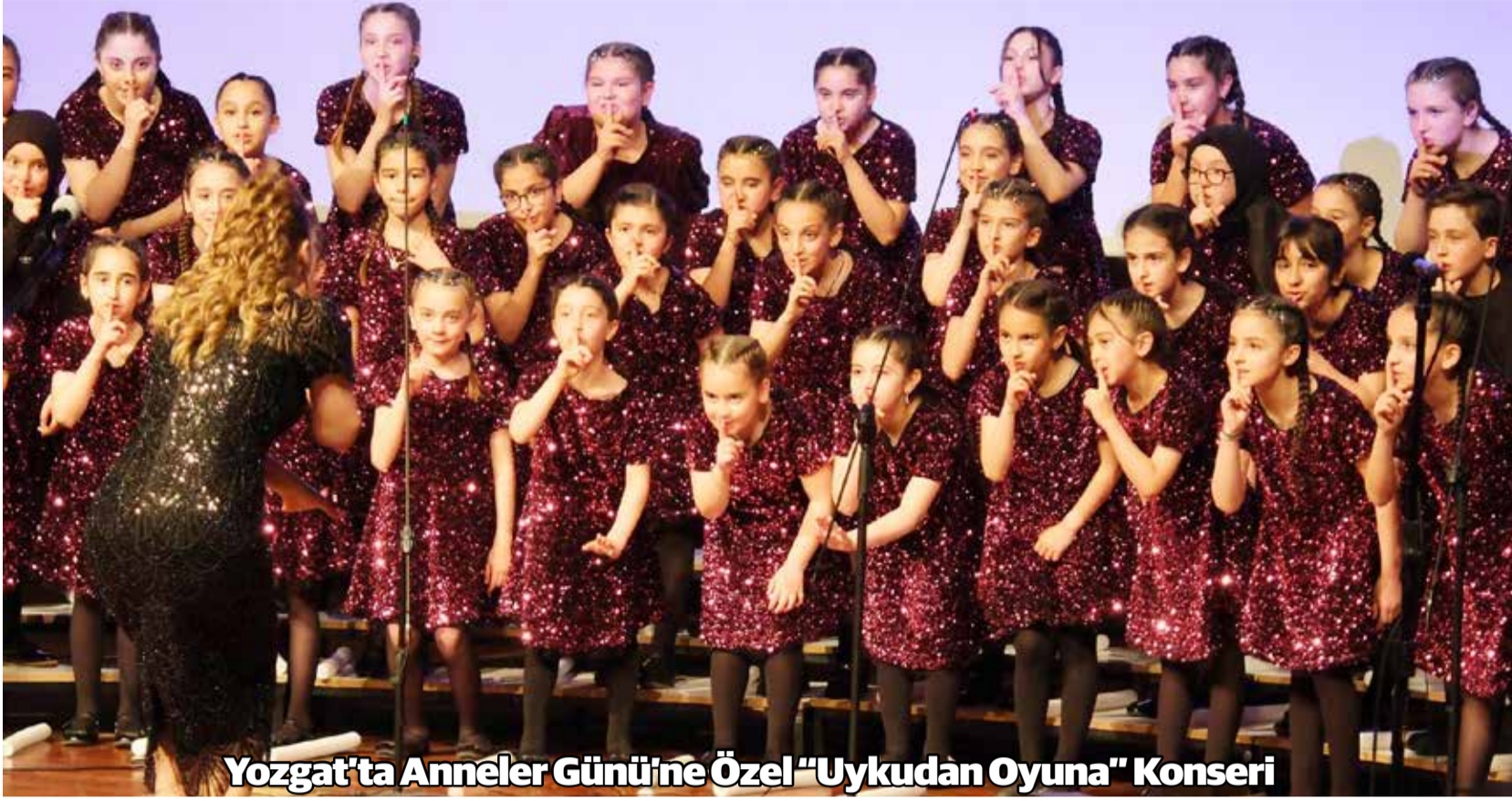
Yozgat'ta Anneler Gününe Özel "Uykudan Oyuna" Konseri