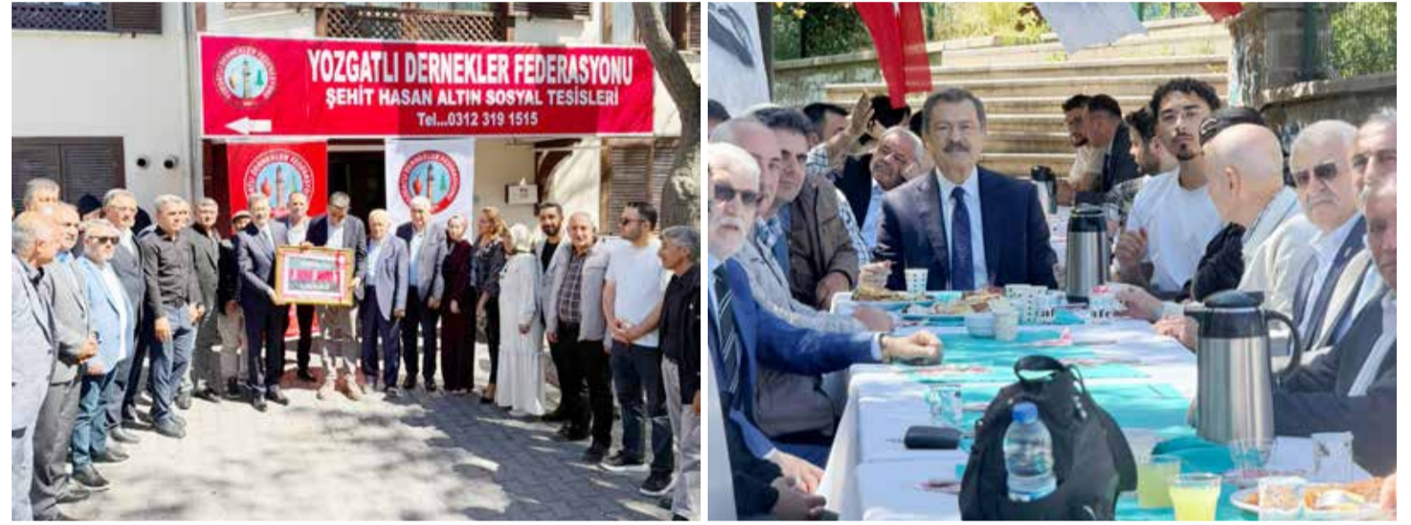
Yozgatlı Dernekler Federasyonu'ndan Anlamli Eğitim Sezonu Kapanış Etkinliği