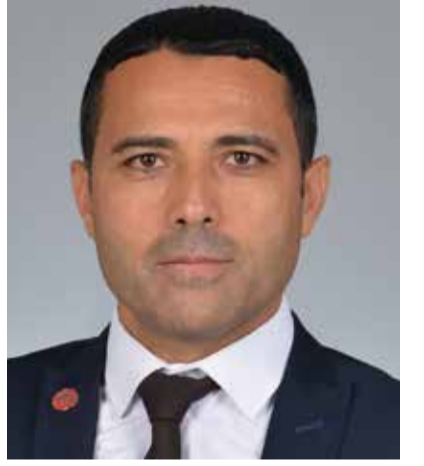
YOZGAT, AMATÖR SPOR EVİ OLAN BEŞİNCİ İL OLABİLİR