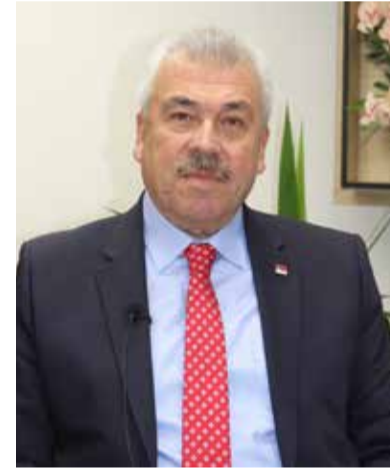
"DELEGELERİN YÜZDE 93'Ü ÖZGÜR ÖZEL'İN ARKASINDA"